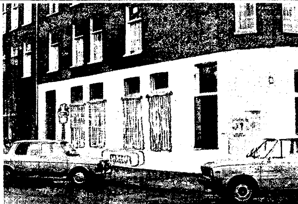
Deze muurschildering wordt uitgevoerd tijdens de Buurtmanifestatie op zaterdag 26 jan.

Klachten over de bezorging: tel. 821133. Redactie-adres: Van Hallstraat 81.