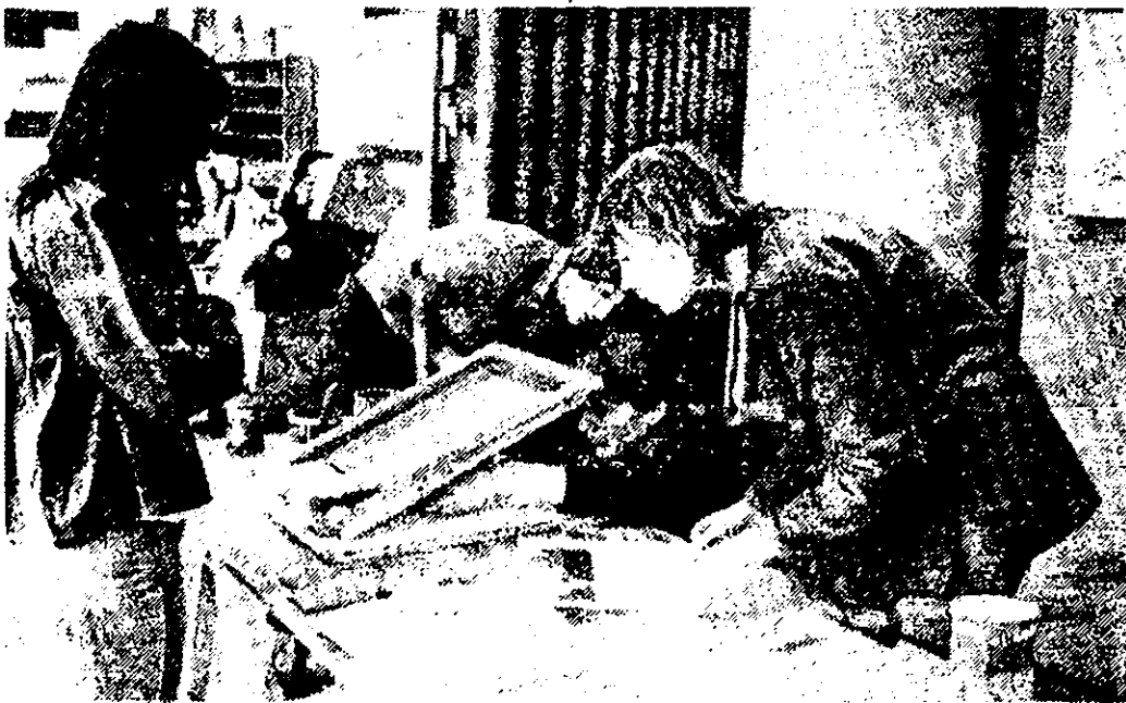
Het drukken van affiches in de Taaldrukwerkplaats

De Van Rappardstraat en Visseringstraat nrs. 1 t/m 7: in juni 1980 woonerf of nog maar eens 13 maanden stilstand?