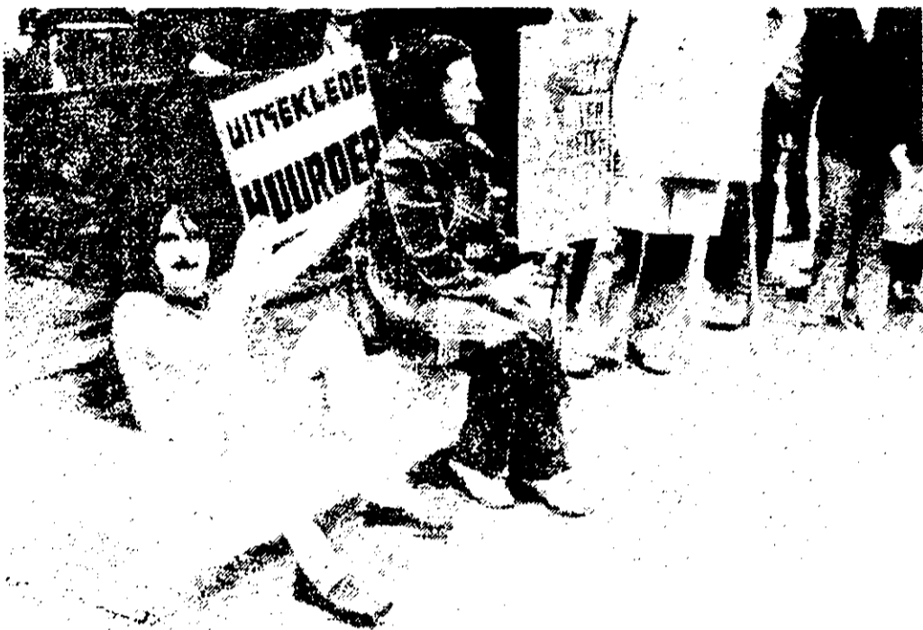
Op dinsdag 24 april werden op het Binnenhof 135.000 handtekeningen, waarvan 70.000 uit Amsterdam, voor handhaving van de huurbescherming aangeboden. De delegatie van 200 mensen uit het hele land werd vergezeld door de 'uitgeklede huurder'.