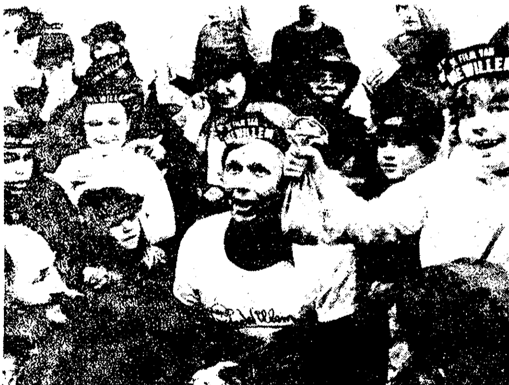
Uit de handen van de bekende TV-figuur 'Ome Willem' van de fillem mochten de kinderen van kleuterschool het Roodborstje en van de 4e klas van de Zaagmolenschool de prijs namens alle kinderen van de Staatsliedenbuurt in ontvangst nemen. De prijs die bestond uit een zak met 400 kwartjes en een grote stapel papier om op te

drukken wordt geregeld gegeven aan scholen of instellingen die iets bijzonders voor de jeugd doen. De taaldrukwerkplaats was erg blij dat de prijs in onze buurt terecht kwam omdat hierdoor het werk weer eens een extra stimulans krijgt.