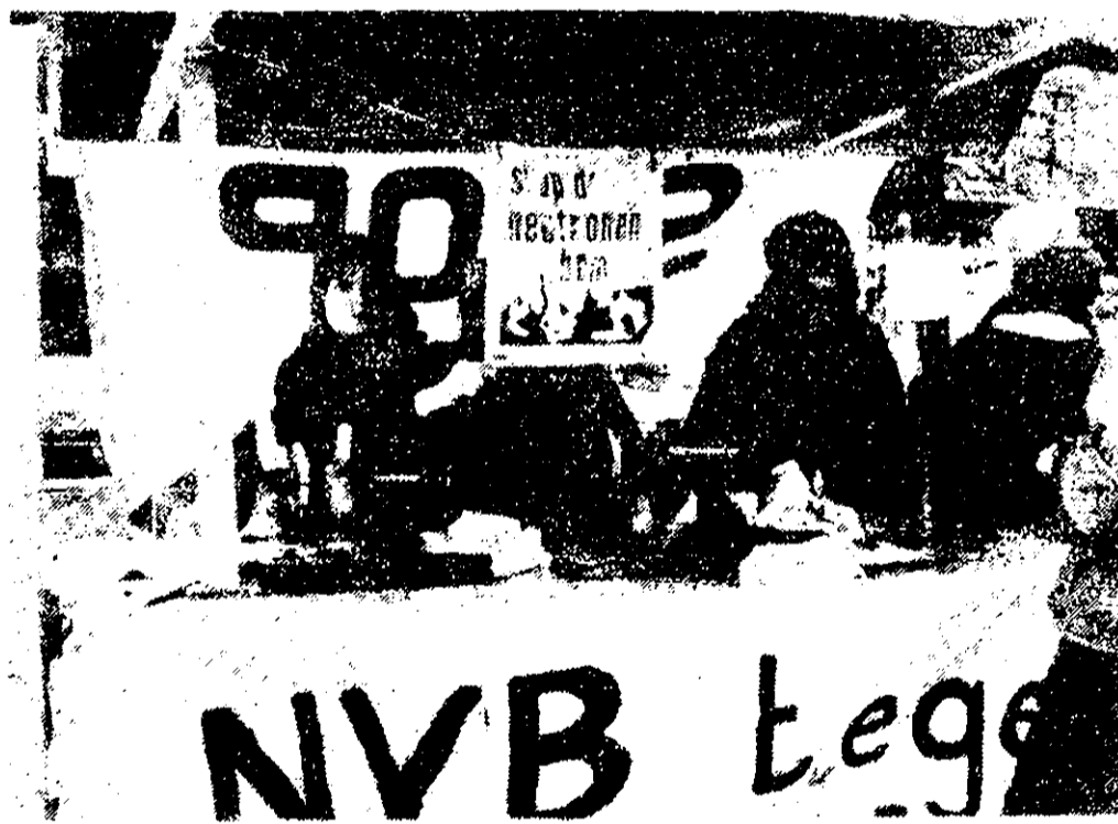
Nederlandse Vrouwen Beweging was ook aanwezig en tegen de N-bom

April 1979 is bijna al weer voorbij en zij was een goede maand voor de actie 'Stop de Neutronenbom - Stop de Kernwapenwedloop'. De eerste tien dagen van deze maand werden in diverse steden in het land bijeenkomsten georganiseerd naar aanleiding van het bezoek van een paar mensen van de Japanse vredesbeweging die al vijf en twintig jaar lang actie voert. Vrijdag 20 april werd aan ambassades in Den Haag een verslag aangeboden van het vorig jaar gehouden internationale forum tegen de Neutronenbom; het was die dag één jaar geleden dat de meer dan één miljoen handtekeningen aan het parlement werden aangeboden. Zaterdag 21 april ging de actie in Amsterdam 'vrolijk verder' met manifestaties in vijf delen van de stad. De werkgroep Staatslieden- Hugo de Grootbuurt had in samenwerking met Jordaan, Haarlemmerpoort-, Wetering- en Waterloopleinbuurt het initiatief genomen tot een happening op de Noordermarkt. De aldaar iedere zaterdag gehouden vogeltjesmarkt werd geleidelijk overgenomen door een toenemende bedrijvigheid van het opzetten van een podium en het inrichten van diverse kramen. Toen dat voltooid was, kwam het fanfarekorps 'Kin-