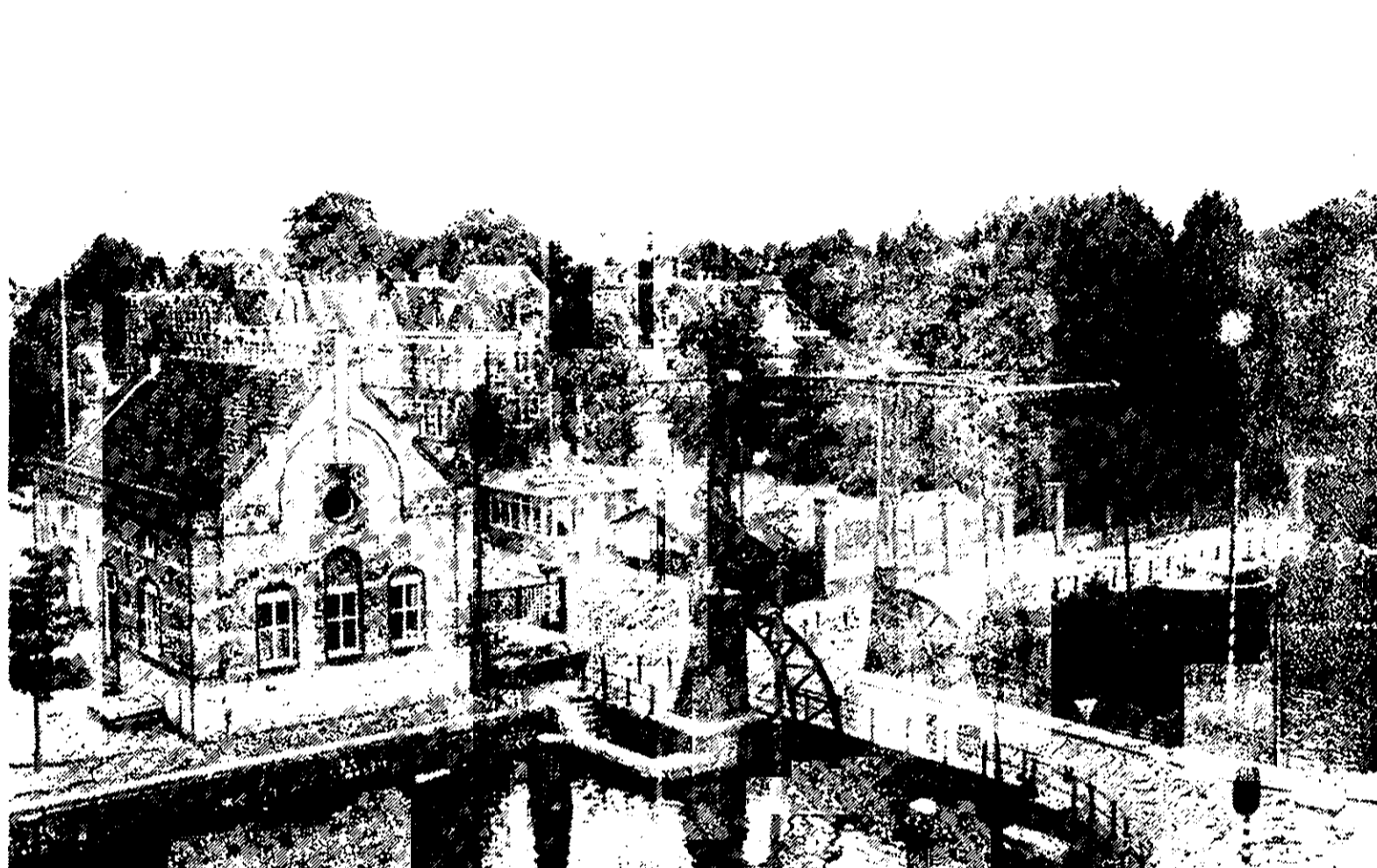
Het Westerpark en gebouwen van het Energiebedrijf

Op 9 en 23 augustus hebben we over deze zaak brieven geschreven aan de gemeenteraad. We werken hierin nauw samen met de wijkcentra De Gouden Reael en Spaarnedam, voor wie het Westerpark eveneens een zeer belangrijke functie heeft. De gemeente heeft in 1974 een structuurnota gepubliceerd,