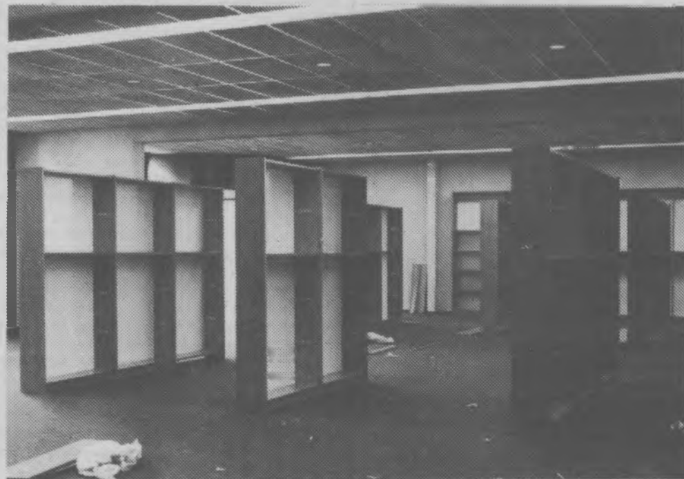
De nog lege bibliotheek. In de grote zaal van de Koperen Knoop zal de tentoonstelling over het ontstaan te zien zijn en in de kleine zaal zullen regelmatig films vertoond worden.