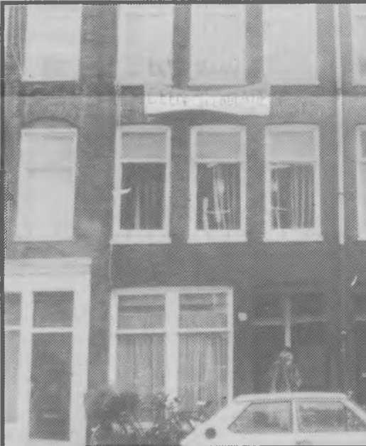
Van Hogendorpstraat 23

Hoe meer verschillende eigenaren er zijn, hoe langer de aankoop procedure loopt voor de gemeente, hoe hoger de kosten worden.