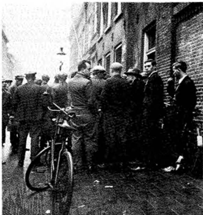
Werklozen voor een stempellokaal.

- Op woensdag 4 juli, precies 50 jaar na het uitbreken van het oproer vindt er op de Noordermarkt een discussie plaats met hen die in '34 aktief waren in de werklozenbeweging en zij die nu aktief zijn op het terrein van uitke-