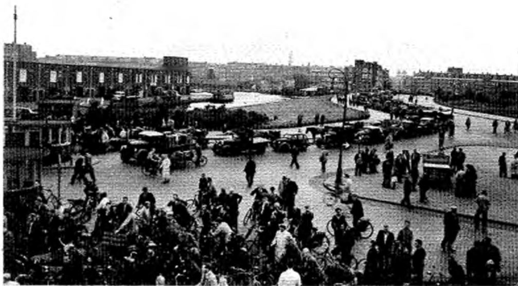
Zeven uur in de morgen. Groentehandelaren wachten tot de hekken open gaan. Foto 1948.

In september 1984 wordt het 50-jarig bestaan gevierd van de A'damse Centrale Groot-handelsmarkt. Deze markt, die begon als een markt voor groente, aardappelen en fruit is in de loop der jaren uitgegroeid tot een groothandelsmarkt voor het totale levensmiddelenpakket. Omdat wij een flauwe interesse hebben voor jubilea en een zeer levendige interesse voor wat er 's avonds op bord komt, meenden wij niet aan deze gebeurtenis voorbij te kunnen gaan.