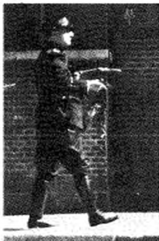
Foto boven: de Jordaan, juli '34, met krantenkoppen uit de Tribune. Linksonder: politieinspecteur in actie. Rechtsonder: 16-jarige jongen werd in been geschoten.

Tot de strijd ons geschaard, idem, 1979.