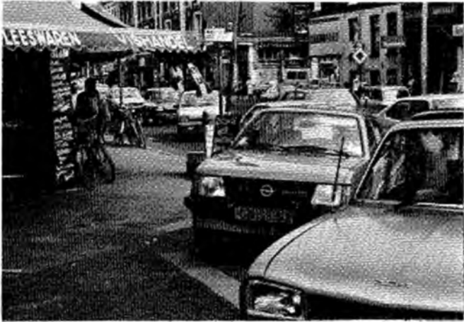
Een ander gevaarlijk punt in de buurt, zie blz. 9.

Dit alles heeft voor nogal wat onduidelijkheid gezorgd. Het was voor veel mensen niet duidelijk of ze nu meer, minder of dezelfde premie