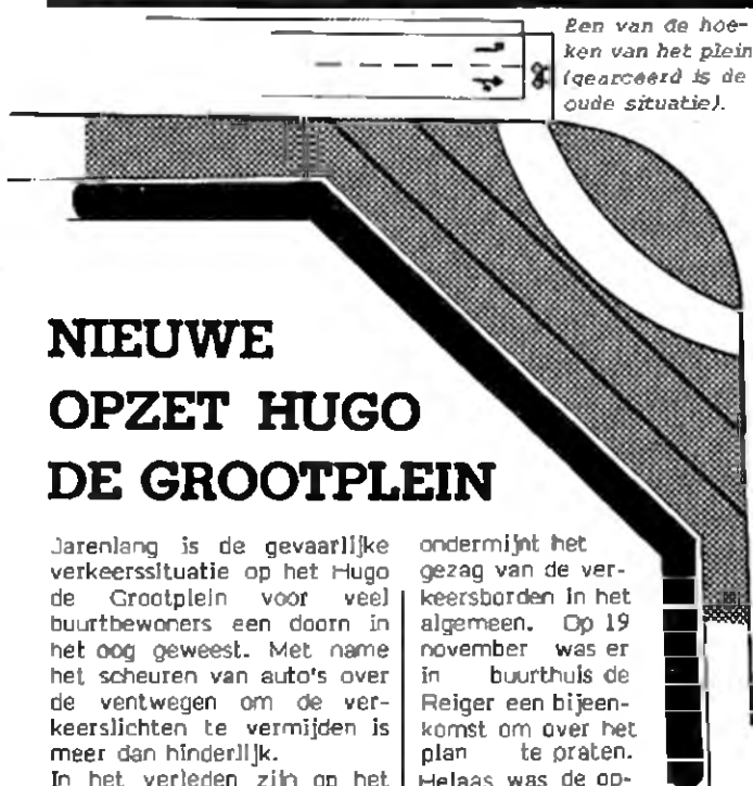
Een van de hoeken van het plein (gearceerd is de oude situatie).