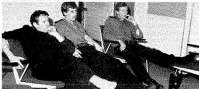
's avonds ontspannen naar de t.v. kijkend