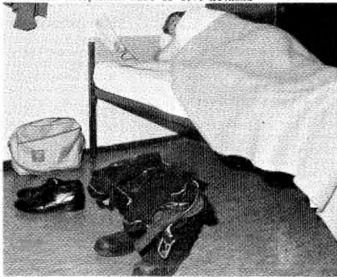
klaar om uit te rukken

De anderen kunnen in de kabine nog even bijkomen. Hij moet meteen in razende vaart zijn weg vinden. Deze ommezwaai van slapen naar ten aanval gaan gaat je niet in de koudekleren zitzen. Het hart heeft dan veel te