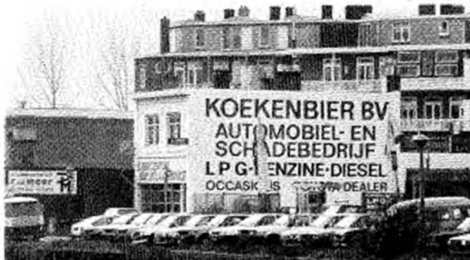
LPG-station gooit roet in het eten.