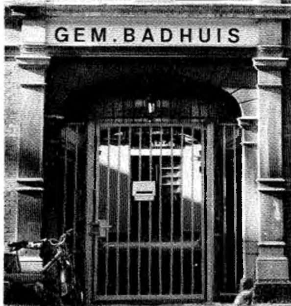
Wat gaat er volgend jaar met het badhuis gebeuren ?

Het gemeentelijk badhuis gaat in de loop van 1985 definitief dicht en het is allerwens, dat het gesloopt wordt en het zicht op de lelijke muren vervangen wordt door groenbeplanting. Er zal nog een uitnodiging komen voor