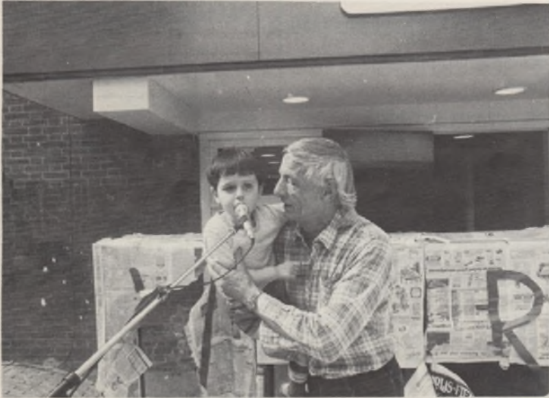
En... eh... nou is... eh... nou is 'ie open...

Op 21 mei gaan de deuren open van het vernieuwde pand aan Hembrugstraat 156/Zaandammerplein 50, bij de meeste mensen bekend als Spaarndammerschool of Spitsbergen- of de Gerard de Veer school.