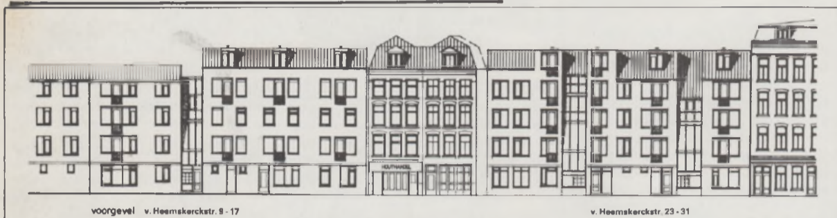
voorgevel v. Heemskerckstr. 9-17