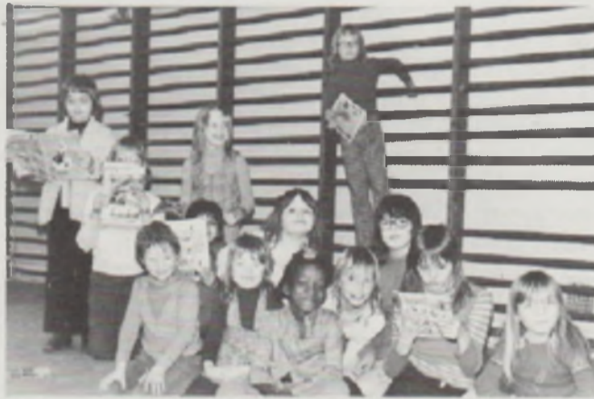
SPORT – SPEL – RECREATIE – ZWEMMEN – MASSAGE

Wat de afmetingen betreft is men van oordeel, dat indien plaats en ruimte dit toelaat, wedstrijd sport mogelijk moet zijn.