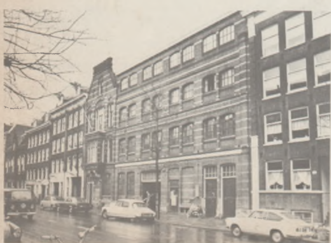
In deze fabriek in de Spaarndammerstraat komt een cash en carrybedrijf inplaats van sport- en spelruimte voor de jeugd uit onze buurt!