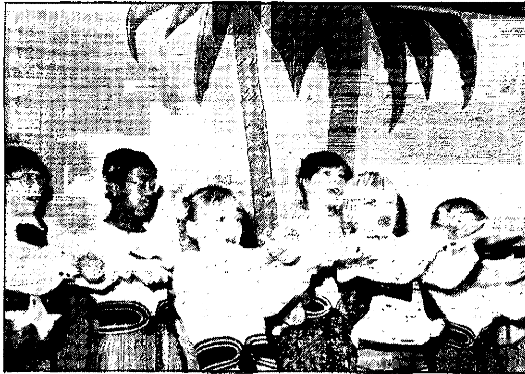
Zondag 25 januari geven leerlingen van de Van Bosscheschool in een totaal uitverkocht Elisabeth pastoraat een uitvoering van de musical: Het Geheim van de Tempel. Een uitgebreid verslag vindt u in de Echo van 5 december. Buurtbewoners die geen kaart hebben kunnen bemachtigen kunnen gerust zijn. In april '80 is er nog een uitvoering in de buurt.

Mensen, die het leuk vinden om die dag mee te werken, kunnen zich opgeven bij buurthuis de Reiger, tel. 845676.