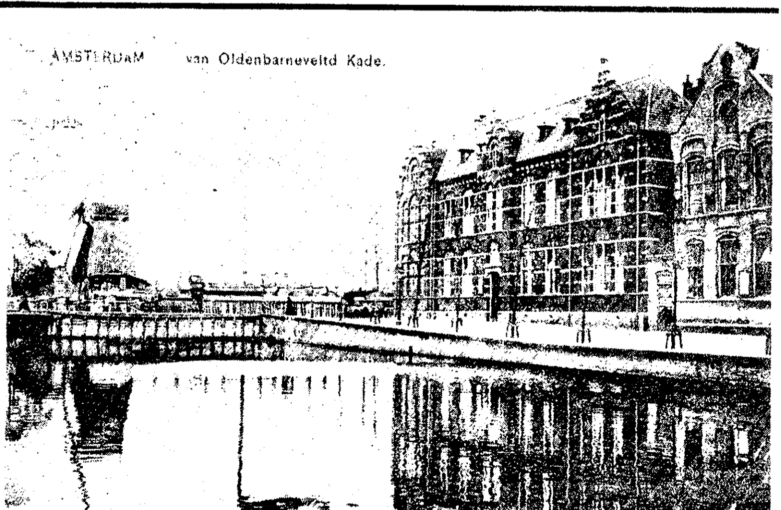
Dit is de Frederik Hendrikschool, 75 jaar geleden. Waar nu het Van Oldenbarneveldtplein is, liep toen de Van Oldenbarneveldtgracht. Waar de molen staat, kijk je nu tegen de huizen van de Fred. Hendrikstraat aan. De ingang in het midden van de school werd tijdens de renovatie dichtgemetseld. Het poortje rechts naast de school is nu de nieuwe ingang. De foto is uit 1904 en is door ons opgevraagd bij de Gemeentelijke Archiefdienst ter gelegenheid van de heropening van de school.