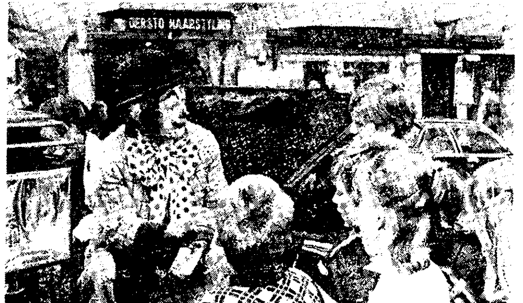
Ter gelegenheid van 50 jaar Winkellers Combinatie Staatsliedenkwartier was Pipo in de buurt