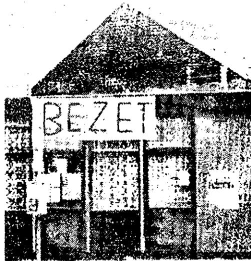
De voorpost tijdens de bezetting.

Gedeputeerde Staten heeft inderdaad vóór