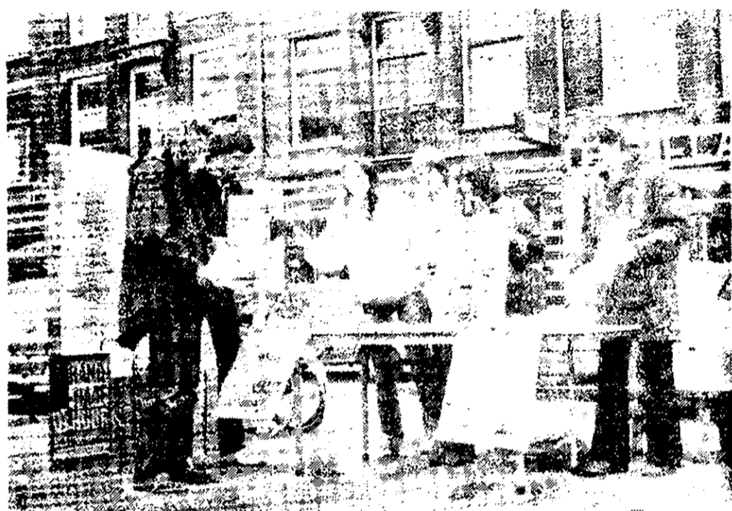
Op het Hugo de Grootplein werden handtekeningen verzameld.