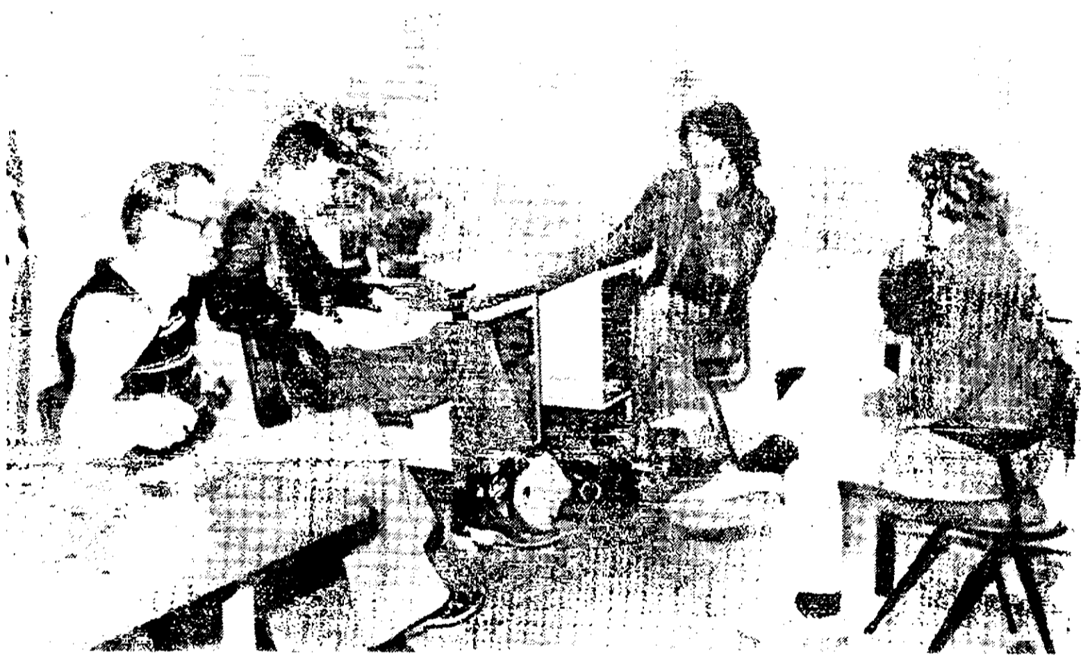
Bezitters in gesprek met wijkraadsliden.

Op 10 oktober keurde B. en W. het verbouwkrediet goed. Daarna keurde ook de Commissie van Bijstand het krediet goed en uiteindelijk moesten ook gemeenteraad en Gedeputeerde Staten hun goedkeuring uitspreken. Wanneer dat zou gebeuren via de normale kanalen, zou die goedkeuring