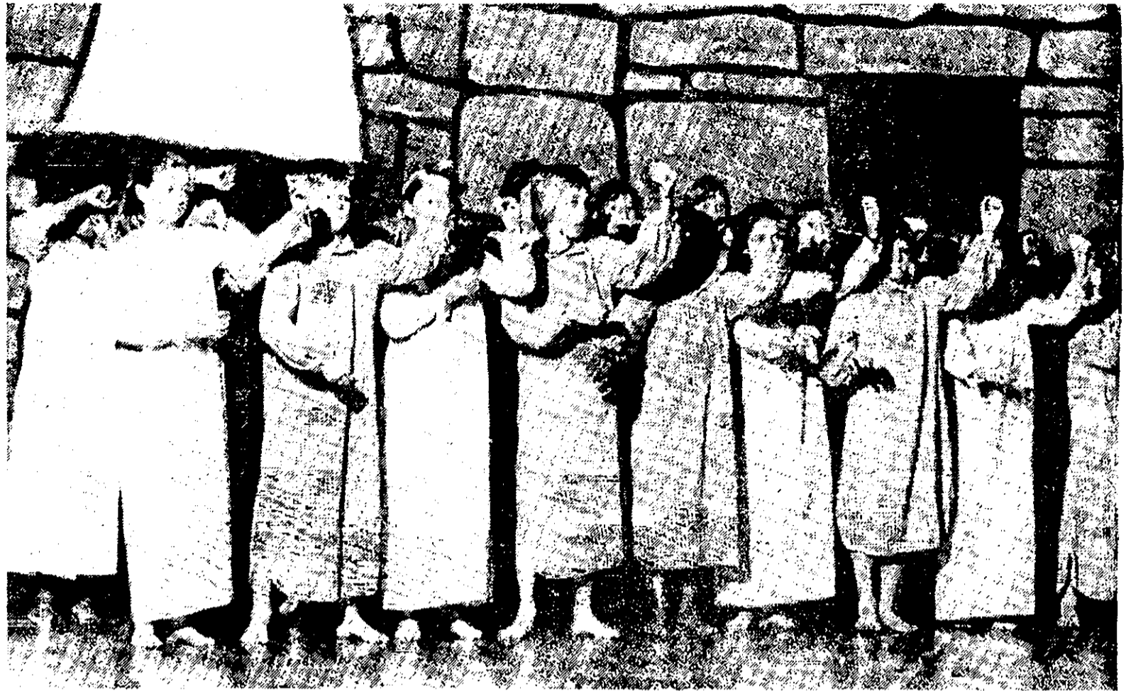
Leerlingen van de Van Bosseschool tijdens een repetitie voor de musical "Het betoverde schilderij".

Voor adressen van huuradvies in de Staatsliedenbuurt zie de laatste pagina van deze krant onder de kop belangrijke adressen.