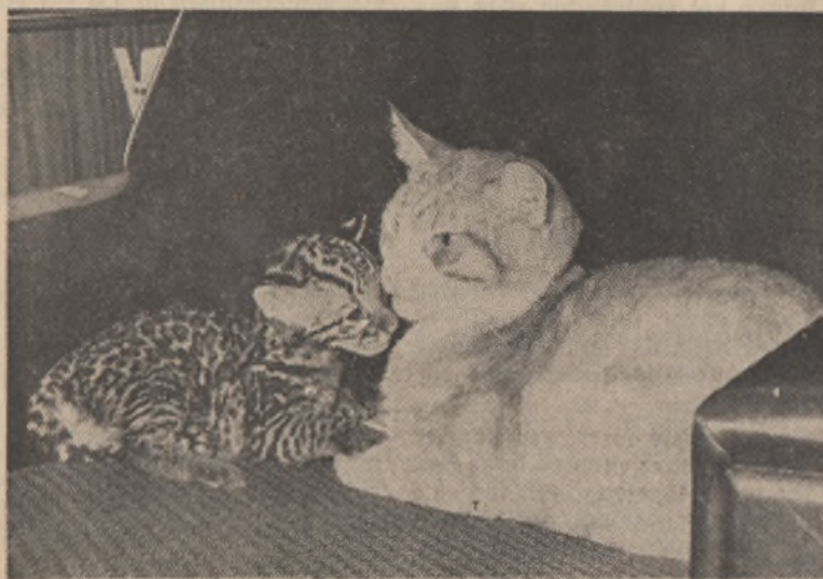
Zij leven niet als kat en hond, deze poes en ocelot.