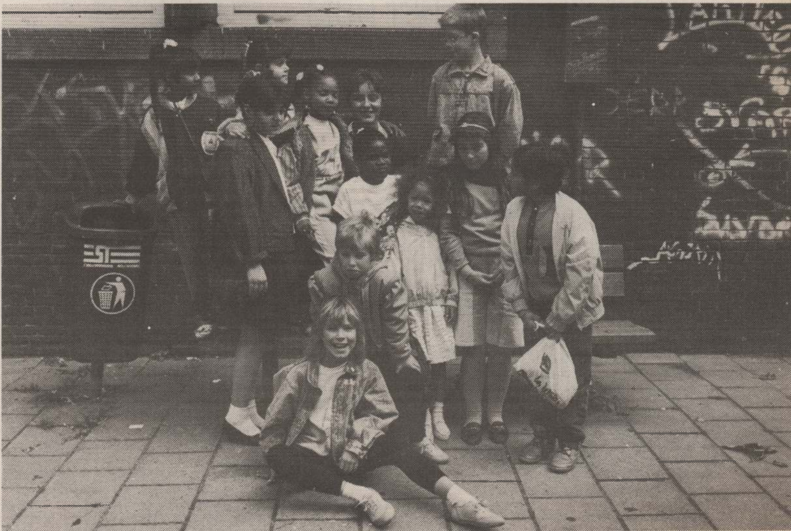
Kinderen uit het buurthuis.