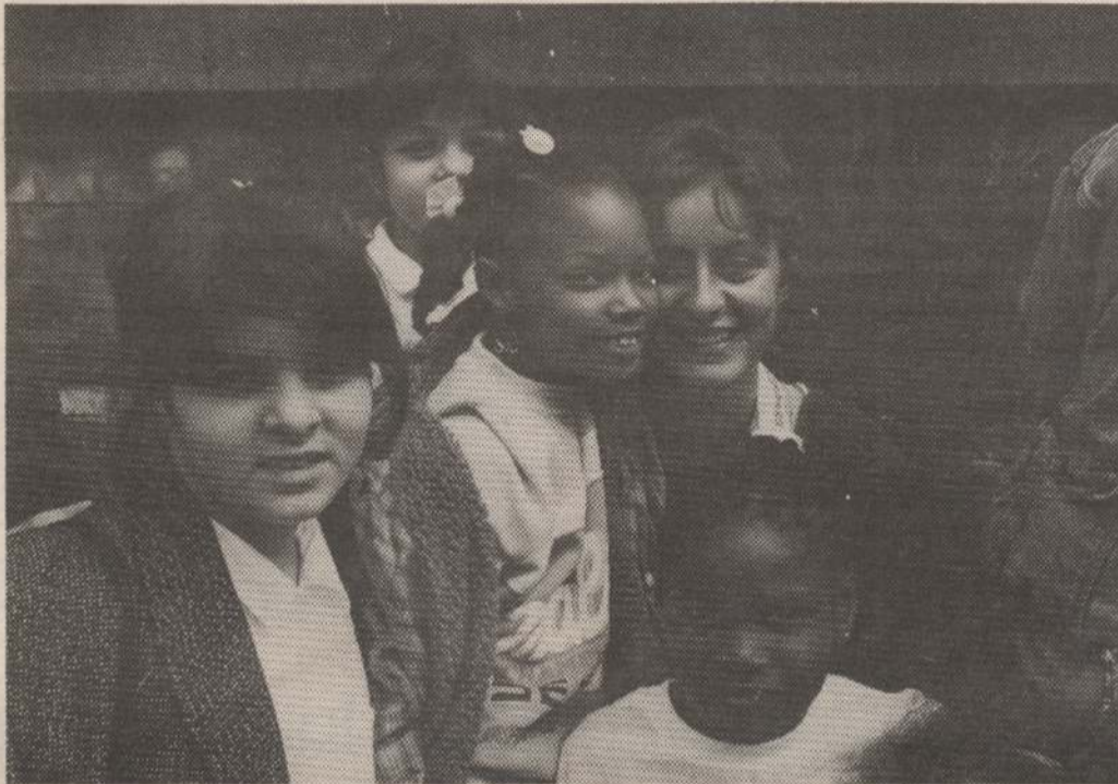
Nita met „haar” kinderen.