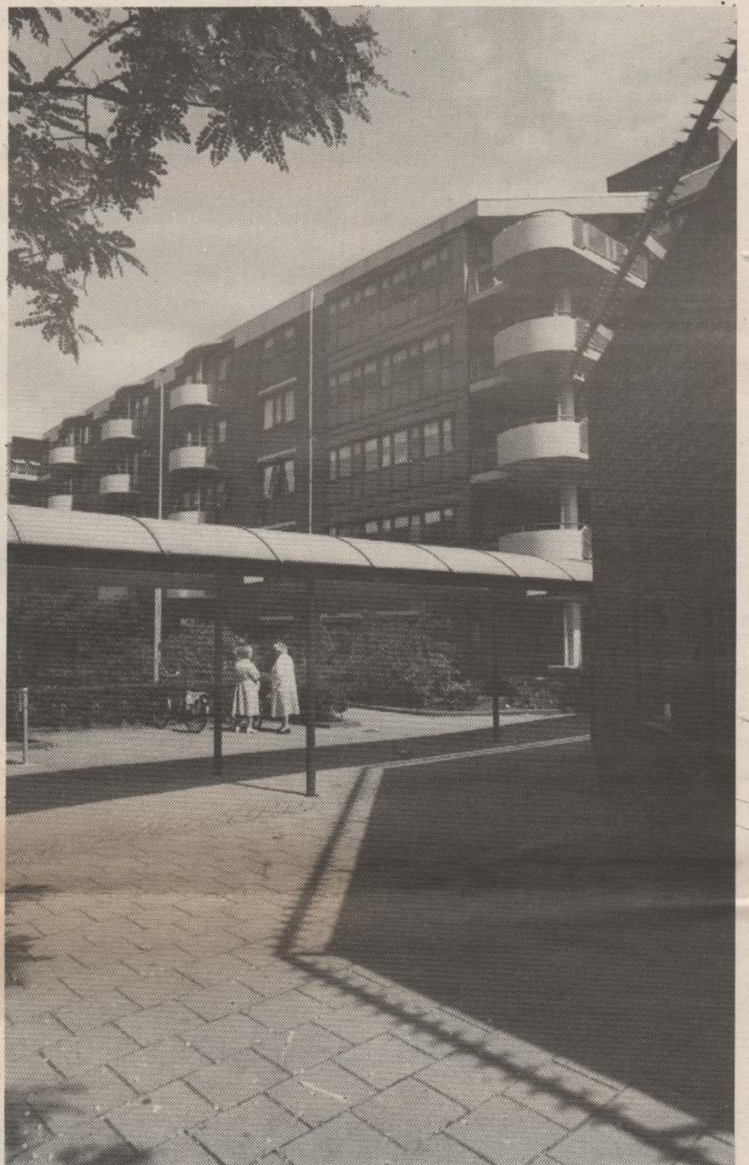
De vooringang van bejaardenhuis De Bogt/Westerbeer

Als in 1992 de stadsdeelraad wordt ingesteld, zal voor het ouderenbeleid een ouderenadviesraad van belang zijn. De Seniorenraad Amsterdam is druk bezig groepen hierop voor te bereiden, zodat die beslagen ten ijs kunnen komen. Het ouderenbeleid zal straks immers door de deelraden worden vastgesteld en uitgevoerd per deelgebied, en dat betekent dat