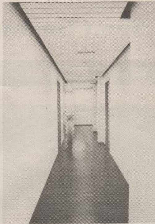
Houtrak met vakantie.