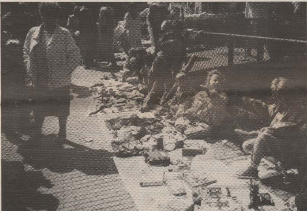
Drukke op de vrijmarkt.