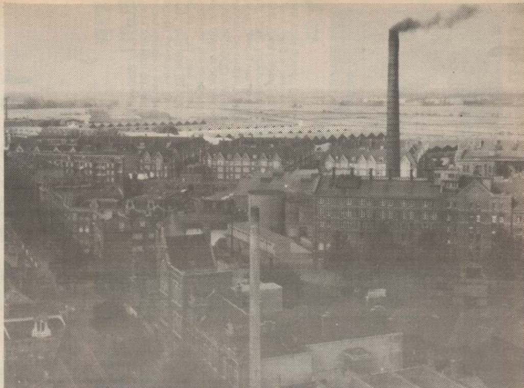
Overzicht van de NV Suikerraffinaderij aan de Houthaven gezien vanaf de Magdalenakerk.

Zo werden de Spaarndammerbuurt en de Zeelheldenbuurt, door de nieuwe spoorlijn scherp afgebakend van de rest van de omliggende buurten.