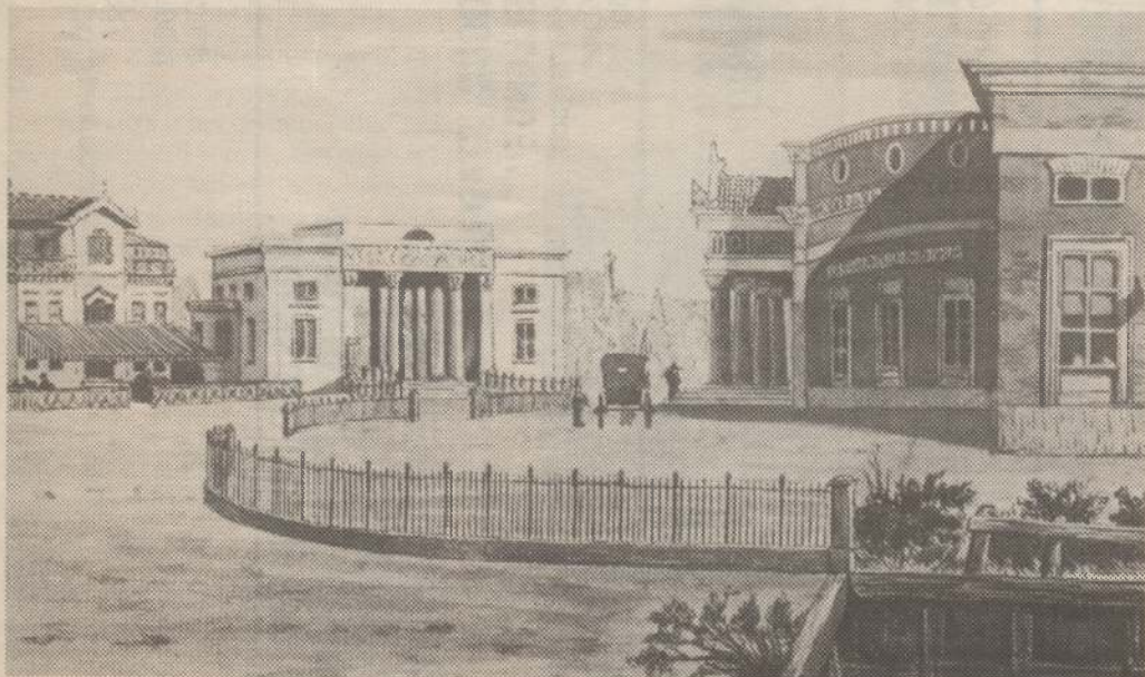
Het Willemspoortstation en het (Willemspoort) koffiehuis er tegenover met op de achtergrond (midden) de Willemspoort.