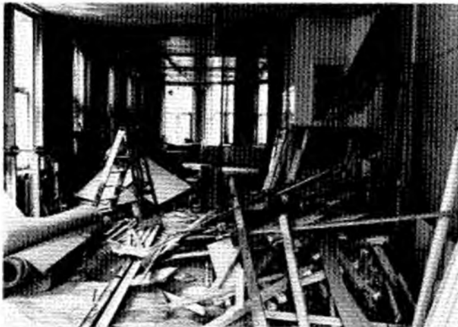
10 jaar zelfstandig op een oudbouw woning...

De woonduur in de buurt moet blijken uit de gegevens van het bevolkingsregister en wordt door Herhuisvesting gecontroleerd.