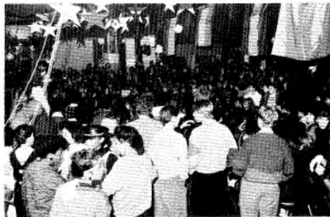
De Buurtkrant was te gast op het Anti-rassisme-feest op de scholengemeenschap Centrum/Oud West