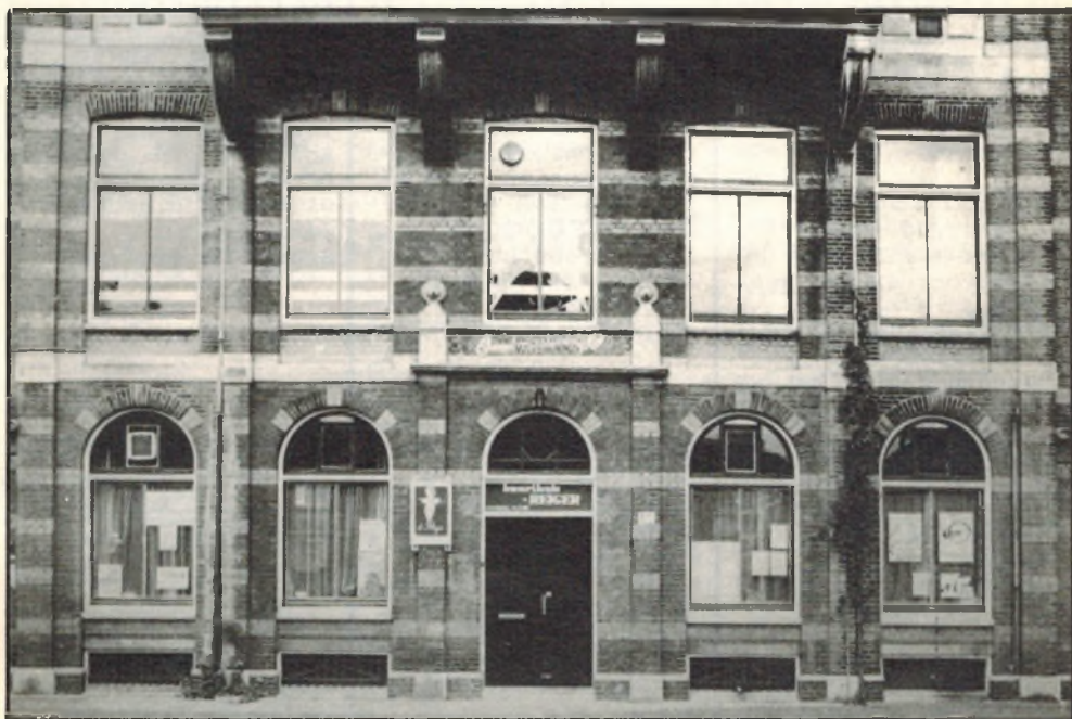
Buurthuis De Reiger, Van Reigersbergenstraat 65

Wanneer in het overzicht van de activiteiten ten achter een activiteit een sterretje staat dan komt u verder in deze krant nog informatie tegen. Wij, buurthuisraad en team van buurthuis de REIGER, hopen er samen met u een goed seizoen '79-'80 van te maken.