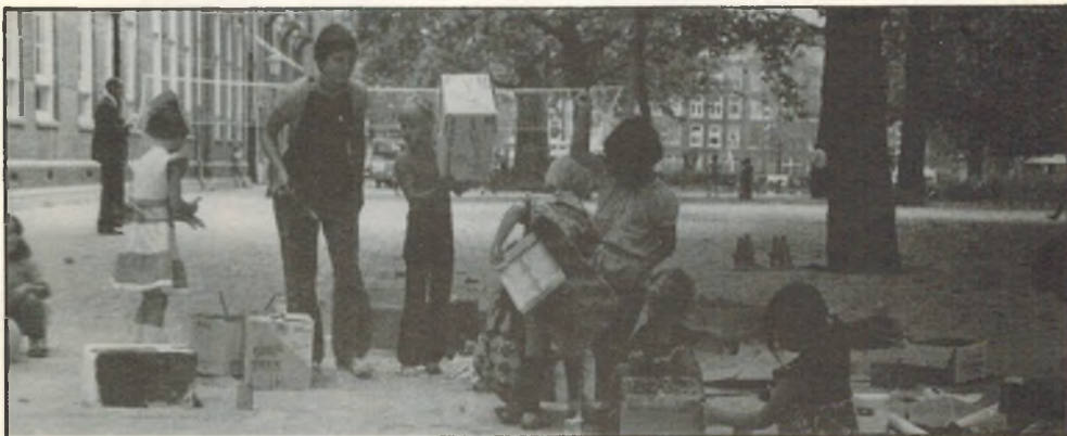
Vakantie activiteiten op het Van Oldenbarneveltdtplein

het Hugo de Grootplein bekend gemaakt. Ook staat het programma in de buurtkrant.