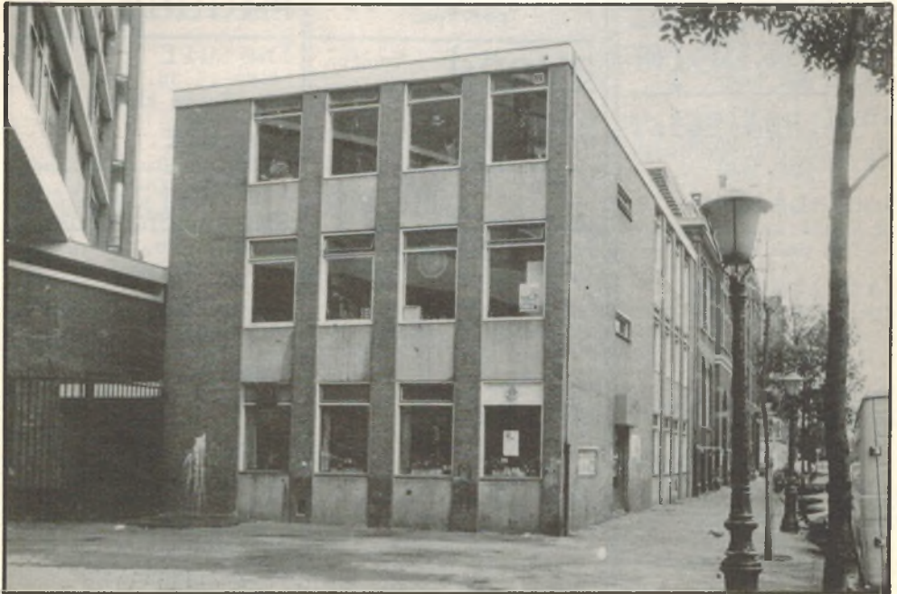
Buurthuis 't Trefpunt, 3e Hugo de Grootstraat 5